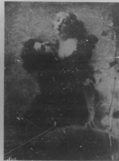
Tranquillo Cremona. "La hiedra".

nuestro gusto, más verista, es Ludvig Dettmann, cuyos "Sembradores" son tan reales como los de Millet y que sabe pintar escenas de nuestra vida cotidiana tan hermosas como "Mañana es día de fiesta" y la "Cena eucarística".