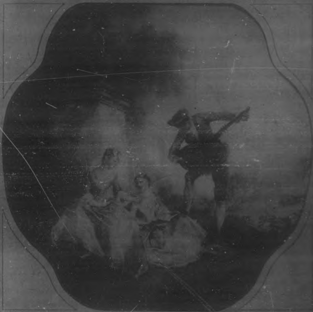
"LA LECCION DE MUSICA". Cuadro de Lanerat.—(Museo del Louvre).