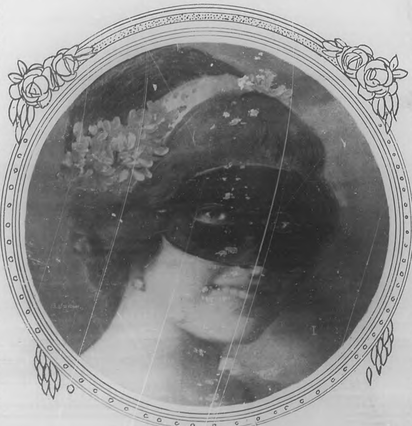
Retrato de la Señorita 1.....?