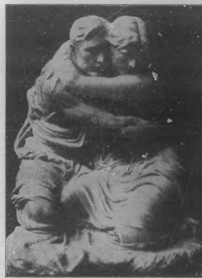
Pietro Canónica. "El abismo".

Había en aquellas salas muchos otros cuadros dignos de atención, algunos mejores tal vez que los mismos de que he hablado, pero cuando el autor de esta crónica pasó