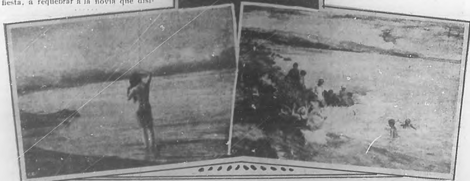
E. R. Ménard. "Desnudo sobre el mar".