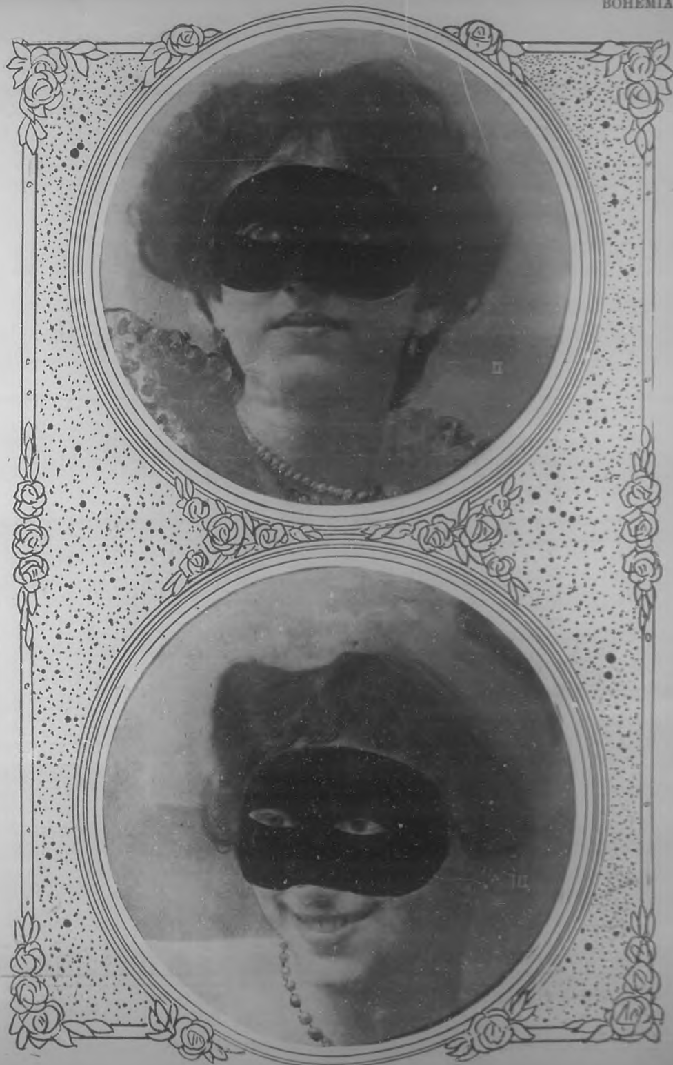
Retrato de las Señoritas 2.....?